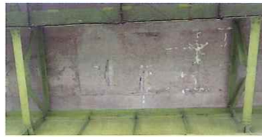
床版下部損傷状況