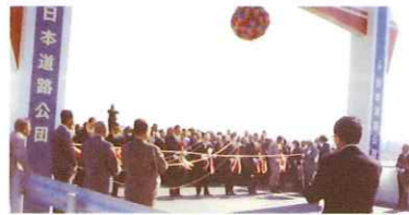
東名阪道の開通時(1975年10月)

開通からおよそ半世紀を迎える E23 東名阪道。長きにわたり愛知・三重をつなぎ、物流・通勤・レジャーなど多くのお客さまにご利用いただけてきました。 老朽化が進む E23 東名阪道では、集中工事など定期的に補修工事を実施させていただいておりますが、部分的な補修の繰り返しだけでは改善できないため、抜本的な補修を実施します。