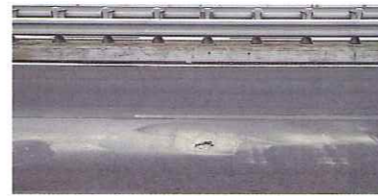
橋の劣化に起因する路面の損傷