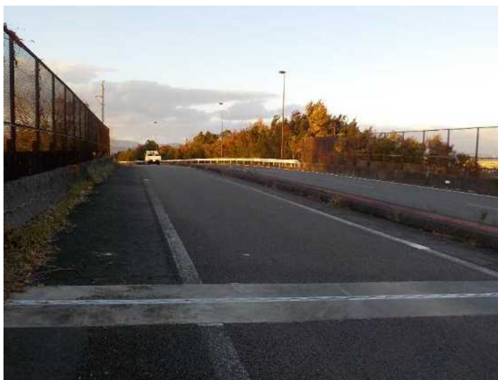
【浜松 IC(上り)ランプ損傷状況】